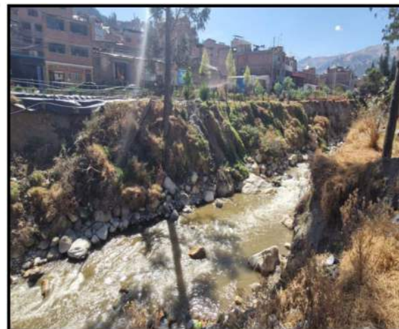
Fotografía 04: se muestra el Rio Calcayhuanca (Rio Auqui--Quillcay) que requieren de conformacion de bordo con material propio limpieza ante un evento extraordinario