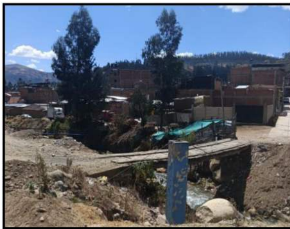
Fotografía 02: se muestra las margenes del Rio Calcayhuanca (Rio Auqui--Quillcay) requieren de mantenimiento