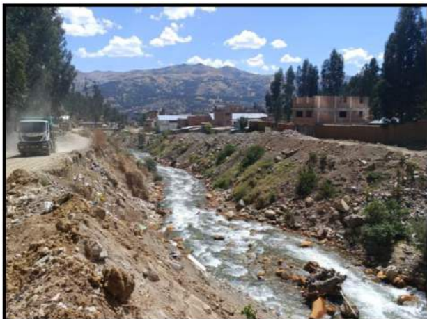
Fotografía 01: se observa la colmatación del Rio Calcayhuanca (Rio Auqui--Quillcay).