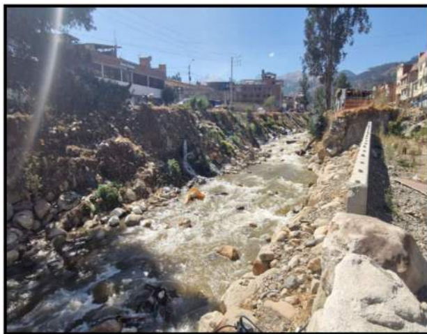
Fotografía 03: se muestra las margenes del Rio Calcayhuanca (Rio Auqui--Quillcay) que requieren de conformacion de bordo con material propio